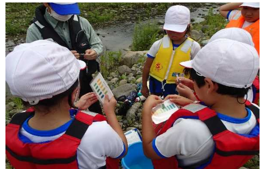
簡易水質測定キットにより水質判定