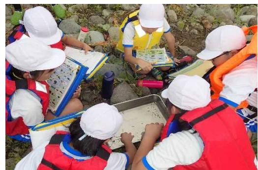
採取した水生生物を判定

※現地での取材の制限はございませんが、ライフジャケットなどの安全用具の着用等をお願いいたします。