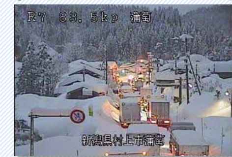
H30. 2. 6