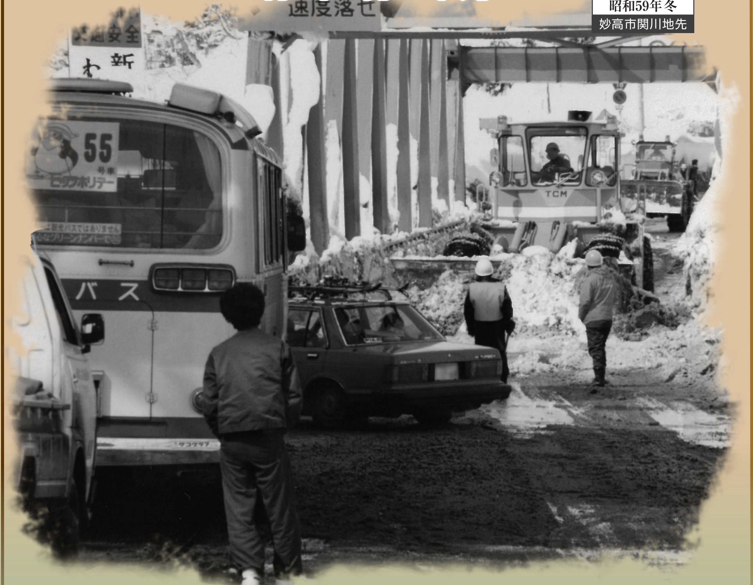
昭和59年冬 妙高市関川地先