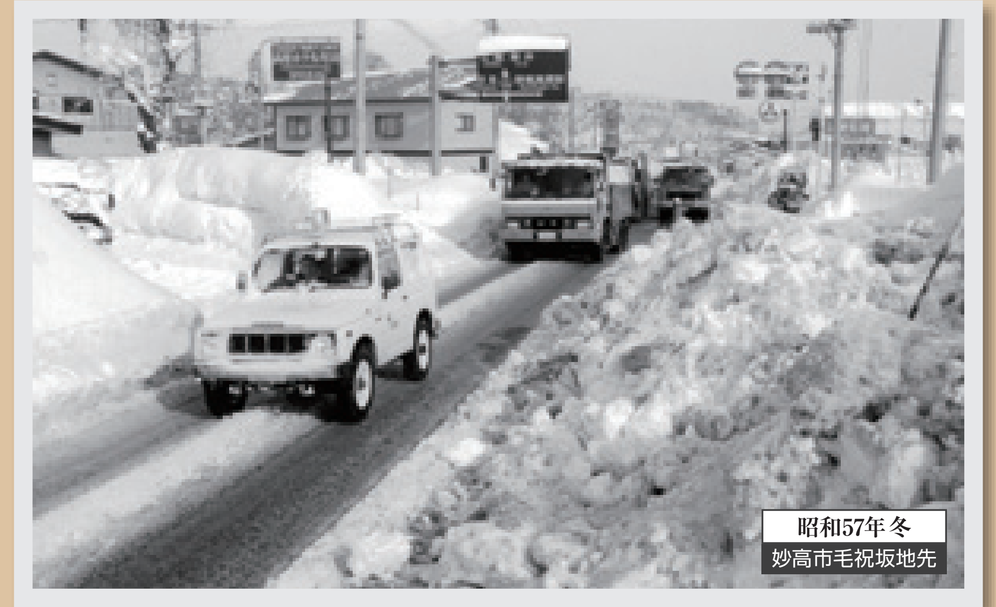
昭和57年冬 妙高市毛祝坂地先