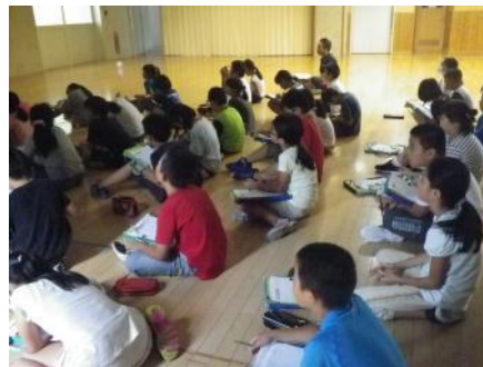
熱心に説明を聞く生徒たち