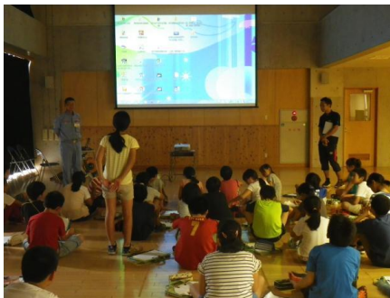
生徒からの質問の様子