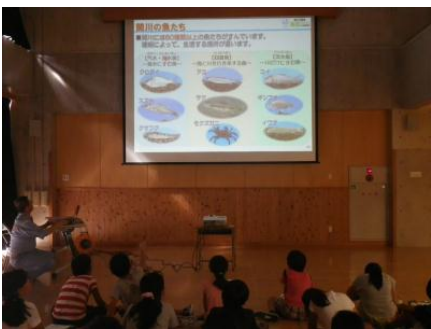
関川に生息する生きもの について学習