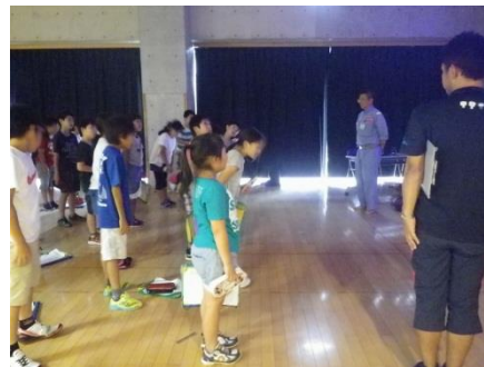
講座のお礼を言う生徒たち

「出前講座」は、北陸地方整備局（高田河川国道事務所）の事業や施策を知っていただくとともに、みなさんのご意見や声を聞かせていただく場として実施しています。職員の知識や経験を活かして、みなさんが持っている様々な興味・疑問などにわかりやすくお答えできるよう取り組んでいます。