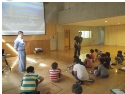
先生からのあいさつ