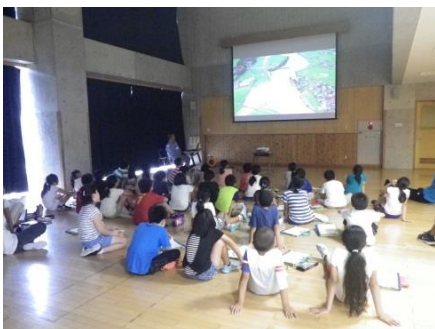
関川の過去の水害について学習