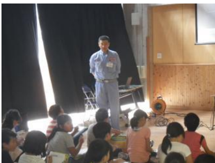
高田河川国道事務所職員からの あいさつ