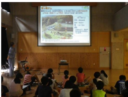
関川の水の利用について学習