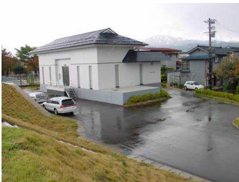
【上越消流雪用水機場】