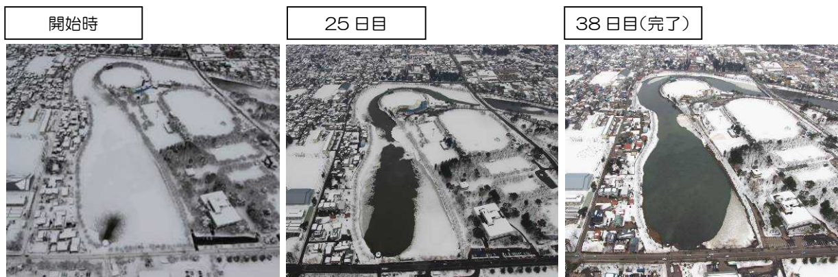
【平成24年冬期の設備稼働状況】

・また、一斉雪下ろしの場所に近接していることから、 運搬距離が短くなり排雪効率が向 上し、生活道路の早期開通や市街地の渋滞等の緩和など、 冬期の生活環境の改善を図りま す。