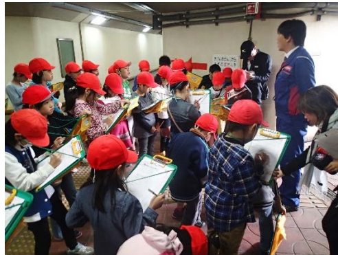
平成28年度実施状況