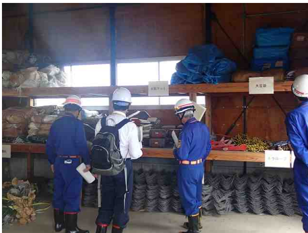
水防倉庫の資材確認 （上越市下箱井地先）