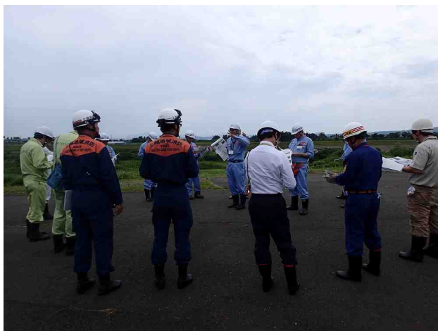
重要水防箇所の確認 （上越市長者原・島田地先）