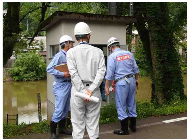
水位観測所の確認 （保倉川有島水位観測所）