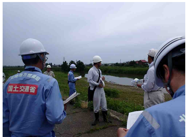
県区間重要水防箇所の確認 （上越市西田中地先）