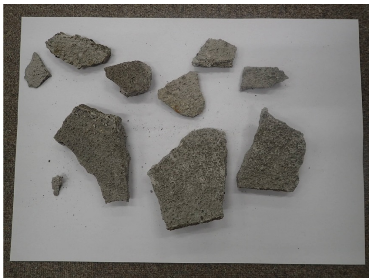
落下物(モルタル片)