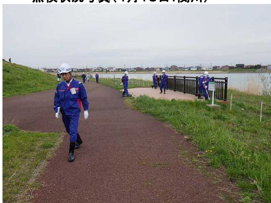
点検状況写真(4月18日:関川)