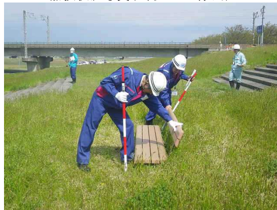
点検状況写真(4月19日:姫川)