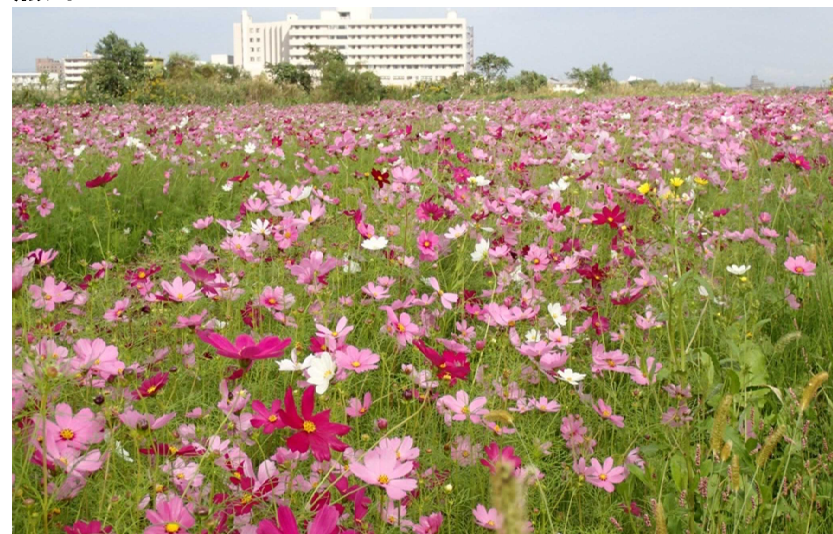
昨年10月中旬の状況