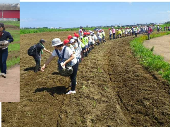
春日新田小学校生徒たち(H28.7.20)