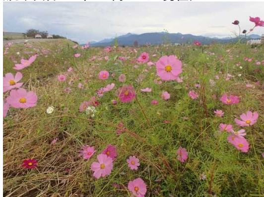
関川大橋上流から妙高山を望む