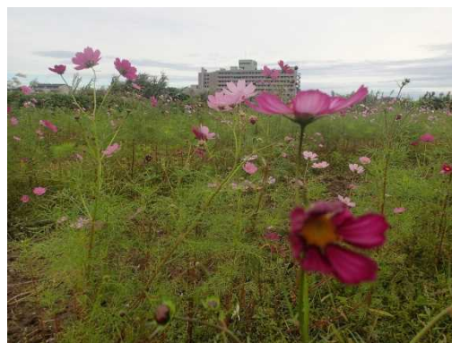
関川大橋下流から労災病院を望む