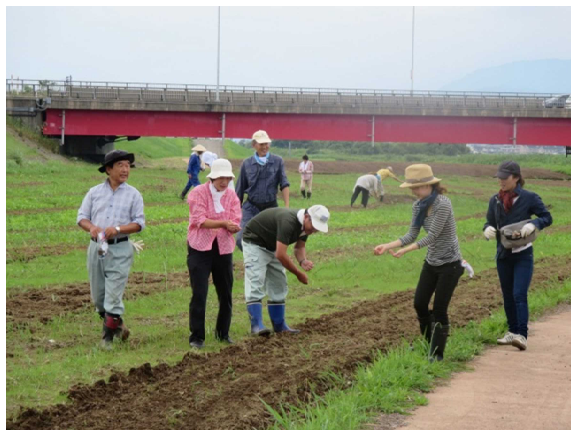
リバーサイド夢物語の 皆さん(H28.8.14)