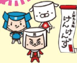
上越忠義隊けんけんす