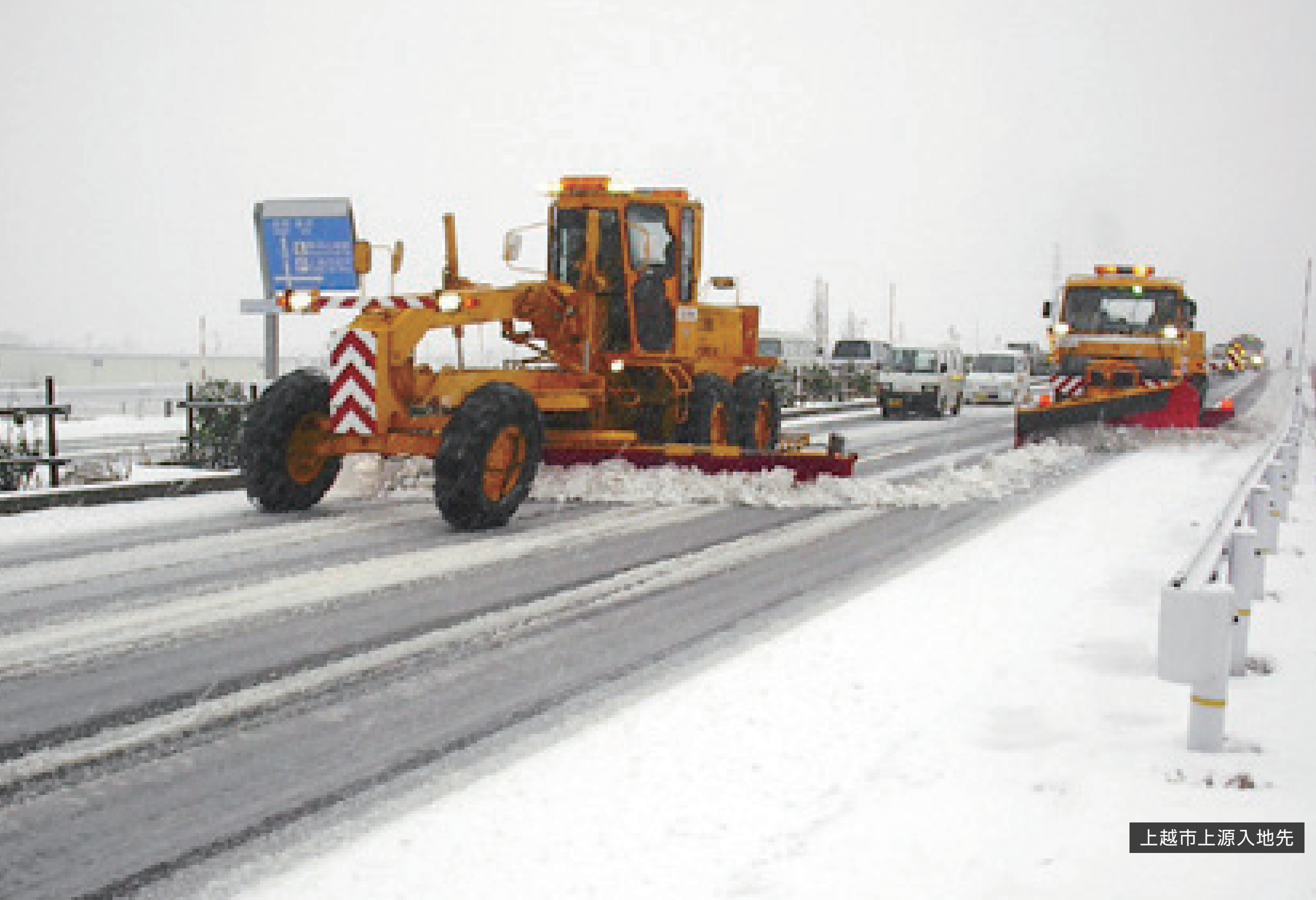
至長野 上越市富岡地先 至国道8号

こうりつてき じょせつ さぎょう あんしん そうこう 効率的な除雪作業で安心走行