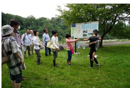
用水路のしくみを体験する様子