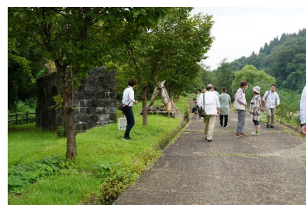
上江用水記念公園内を散策