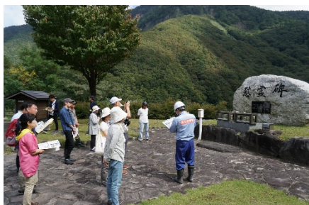
蒲原沢慰霊碑前での土石流災害 についての説明状況