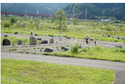
姫川支川に産出する石 の散歩道を散策