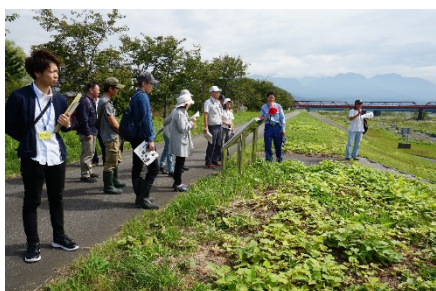
姫川ふれあい石公園と桜づつみ についての説明状況