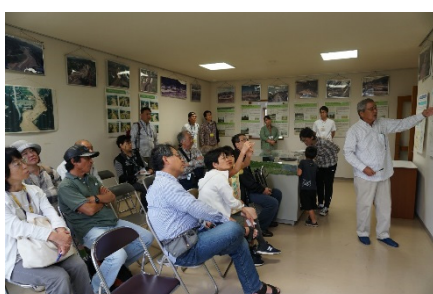
7.11水害の被災概況説明状況