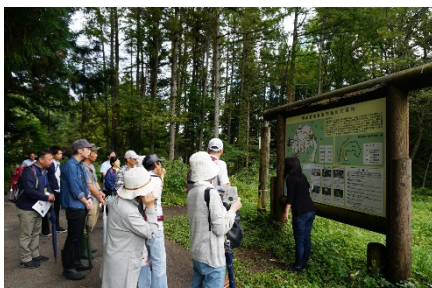
姫川源流・親海湿原について の案内と説明