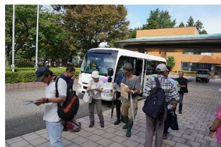
糸魚川市役所にて解散