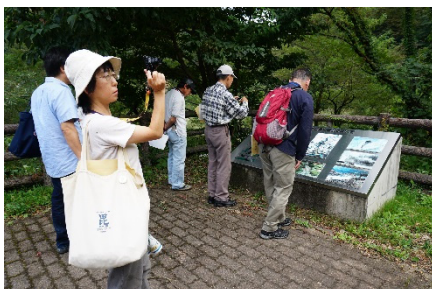
平成8年12月6日の蒲原沢土石 流災害詳細説明パネルを見学