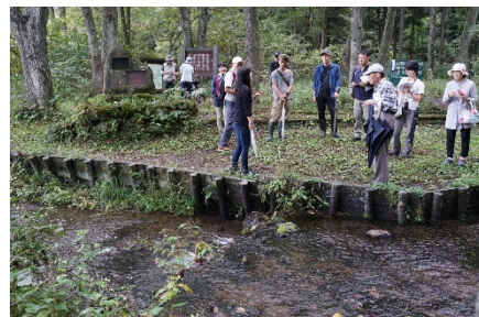
穏やかに湧き出す姫川の源流 の説明状況