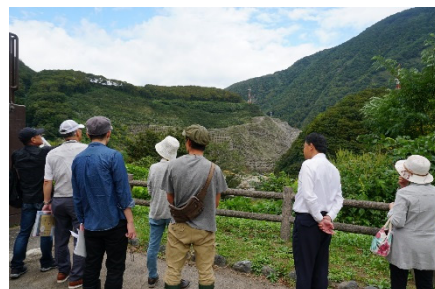
葛葉山腹工についての説明状況