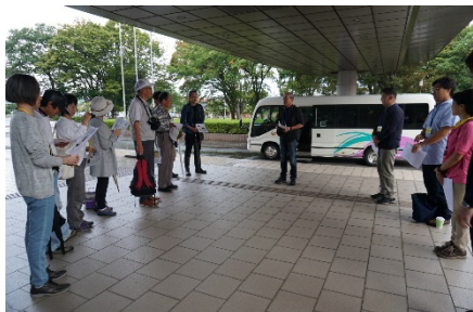
糸魚川市役所での 出発オリエンテーション