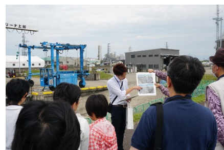
船舶の不法係留の防止と適切な 河川利用についての説明状況