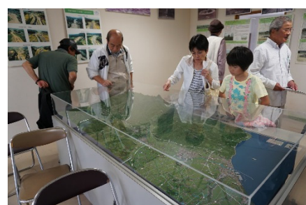
ジオラマで関川流域の 治水施設を確認