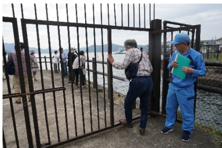
一般立入り禁止の 野尻湖揚水所へ