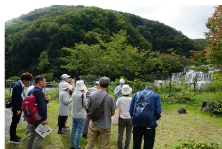
平川・松川の砂防事業に ついての説明状況