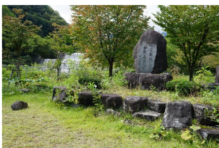
平川源太郎砂防堰堤と 「はじめに砂防ありき」の石碑