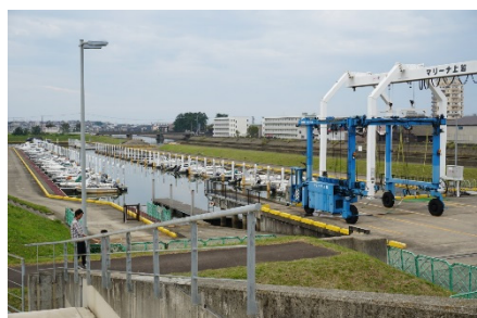
マリーナ上越（保倉川）