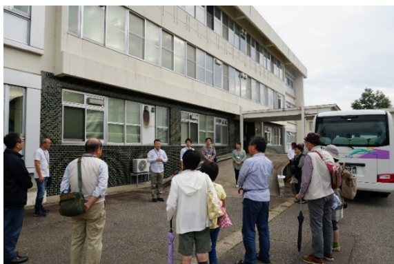
高田河川国道事務所での出発オリエンテーション