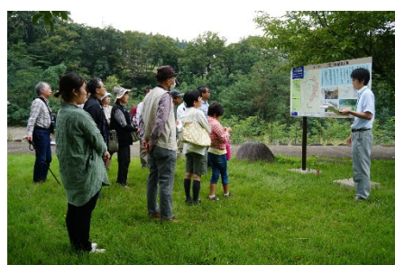
上江用水記念公園での農業用水 路について説明状況