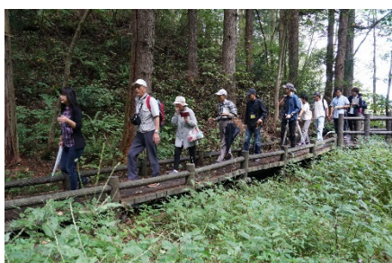
姫川源流の遊歩道を 植物を觀賞しながら散策