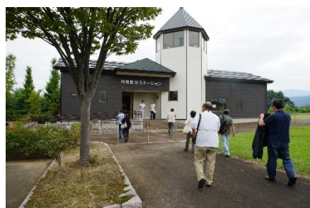
月岡防災ステーション