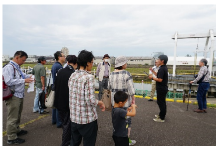
マリーナ上越の施設に ついての説明状況