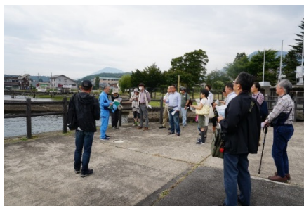
野尻湖の水利用について の説明状況