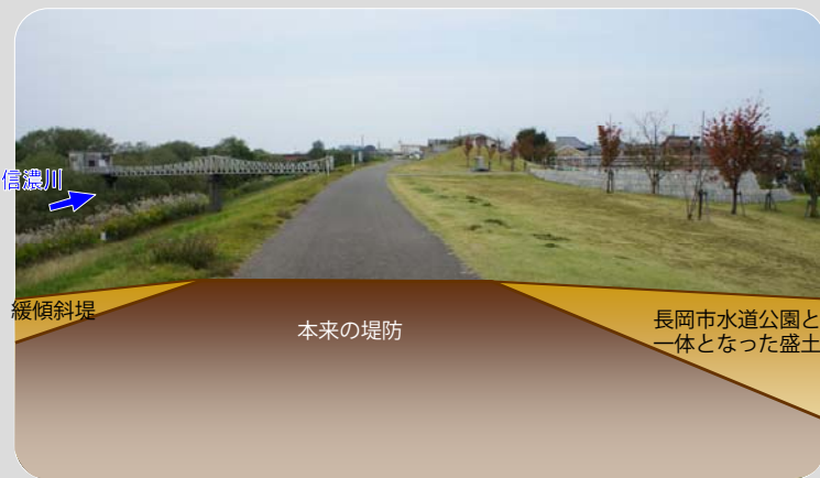
図11.2.3 長岡市水道公園付近の堤防