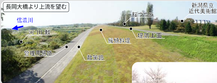
図11.1.2 一体となって整備された堤防

新潟県立近代美術館等の千秋が原ふるさとの森や桜づつみと堤防、そして自然あふれる河川敷が一体となっているのがわかります。