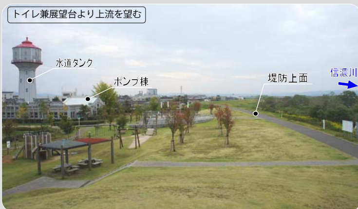
図11.2.2 一体となって整備された堤防