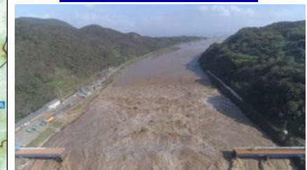
山地部掘削・低水路掘削