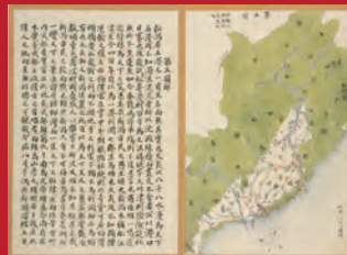
請願資料の一つ北越治水策

彌彦神社は地域の信仰の中心であるとともに、明治3年の第一次大河津分水工事の安全祈願のために建立された神社が十柱神社に合祀されているほか、請願や工事に関わる資料が数多く収蔵されており、大河津分水と深い関係があります。