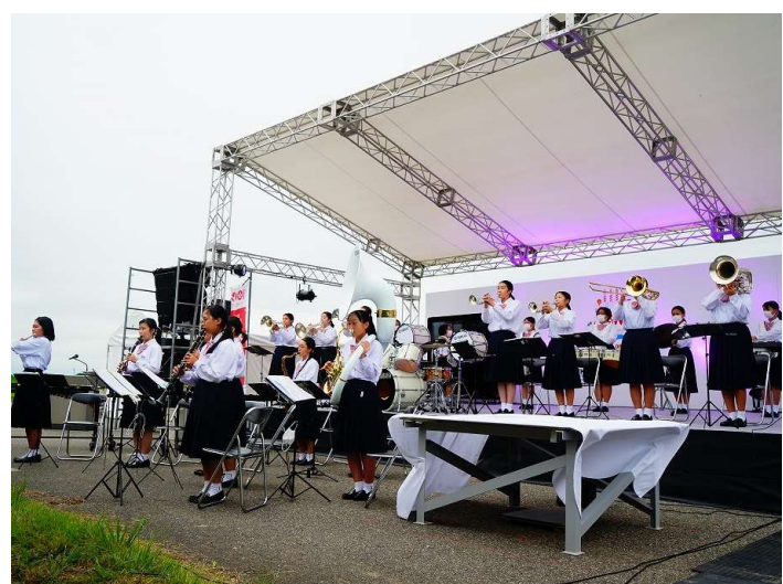
「感謝の想いが伝わるように演奏したい」と想いを乗せた分水中学校吹奏楽部の演奏は、大河津分水の景色と共に鑑賞する贅沢な時間になりました。