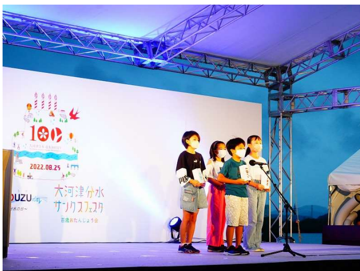
分水小学校の4年生が製作した灯籠の紹介。代表児童の4人が灯籠に書いたメッセージの想いを発表してくれました。