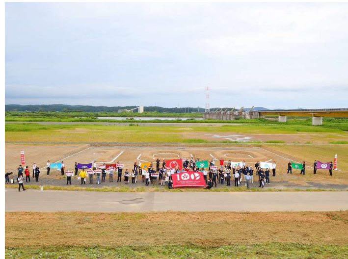
パワーショベルなどで造成した100の文字を背景に周年事業実行委員9市町村旗が並び、地域の方々との連携を発信しました。