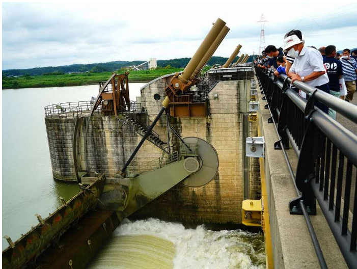
100年前の通水を再現し、可動堰のゲートを開放しました。圧巻の流水音に会場からは歓声が上がりました。