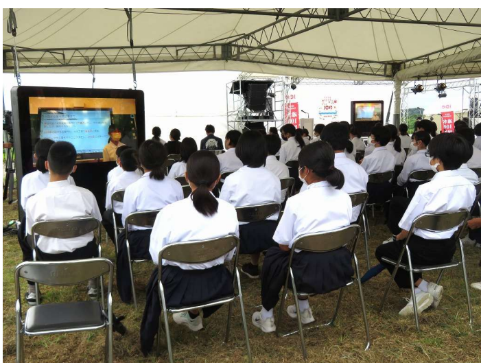
大河津分水の大切さを、防災・観光・地域への想い・未来の4つのテーマで分水中学校1年生から学習してきた成果を発表していただきました。