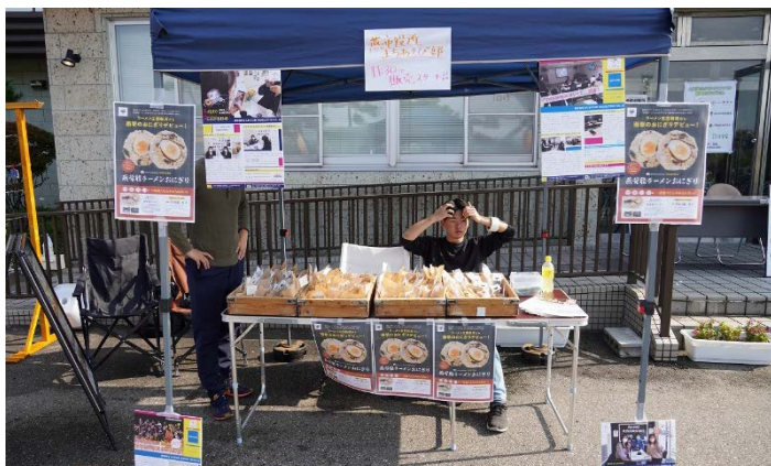
まちあそび部からは「燕背脂ラーメンおにぎり」の販売もありました。