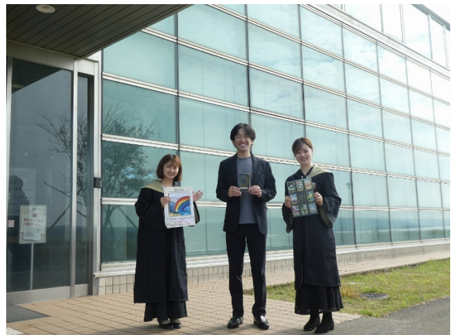
気象予報士の加藤直樹様、スタッフの皆様、ためになるお話をありがとうございました。