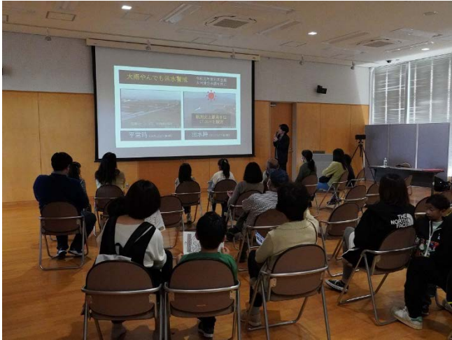
気象予報士による講演会、「目指せ！水ぼうさい博士！」には、多くの親子が参加しました。