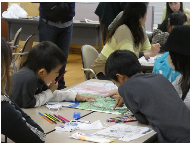
ワークショップでは信濃川流域の立体地図に触れる時間もあり、山の隆起を自分の手で体感する様子も見られました。