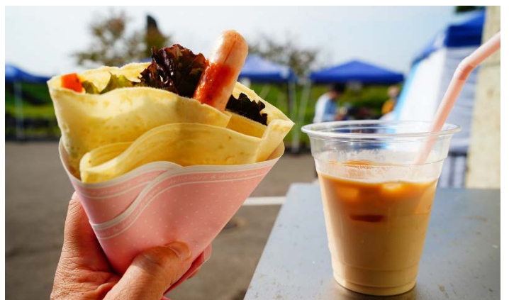
クレープやたご焼きなど、キッチンカーに並ぶものも色とりどりででした。