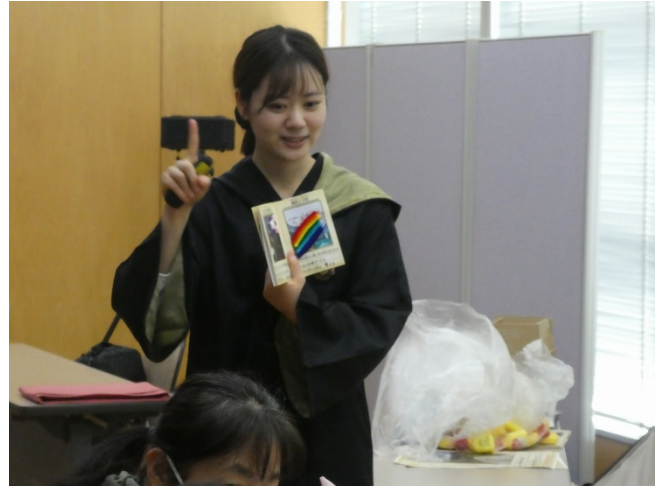
ワークショップでは天気や防災にちなんだ冊子を作成。スタッフが丁寧に作り方を説明してくれました。