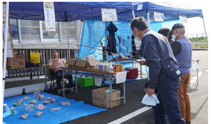
お菓子釣りや射的など、大人も子どもも夢中になる出し物がたくさんありました。