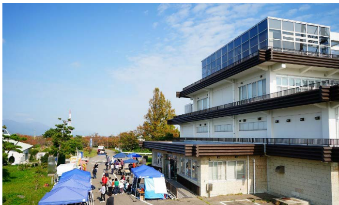
資料館前にはキッチンカーやテントが並びました。当日は天候にも恵まれ、多くの方が来場しました。