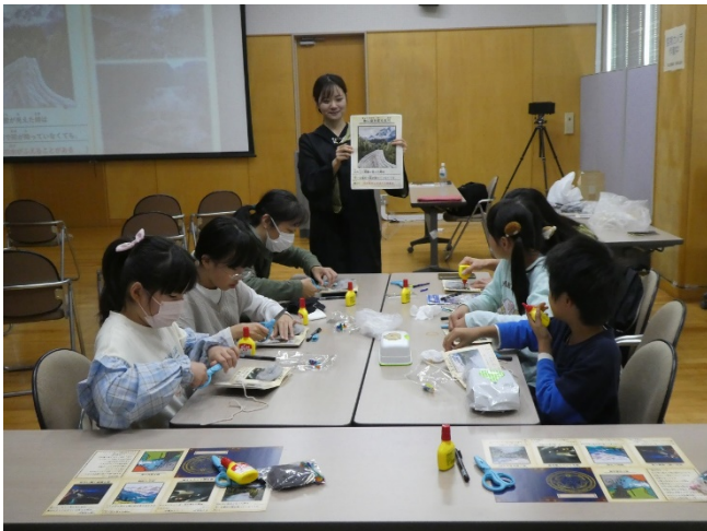
参加した子どもたちは、真剣な表情で手を動かしていました。