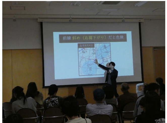
講師による天気の解説は実際の写真や天気図を用いたお話で、参加者は興味深く聞いていました。