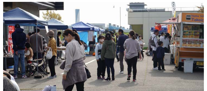
「信濃川」をテーマに語るみずべトークライブの他、様々なブースが出店されました。

期日：令和5年11月5日(日) 会場：信濃川大河津資料館他 参加：500名 共催：Love River Net・つばめ若者会議れつつばめ・燕市 後援：国土交通省北陸地方整備局信濃川河川事務所 協力：新潟経営大学中島ゼミ、ATC、新生会、ieスタジオ、NPO法人信濃川大河津資料館友の会、わくわくお天気・防災教室実行委員会、(株)エコロジーサイエンス