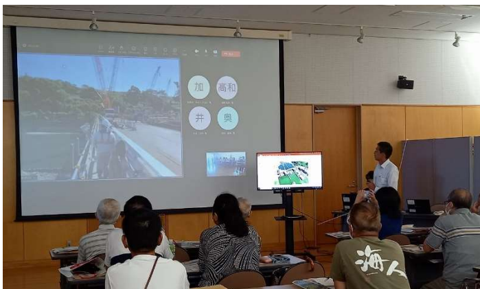
令和の大改修の工事現場がリアルタイムで映し出されると、皆さん画面にくぎ付けでした。