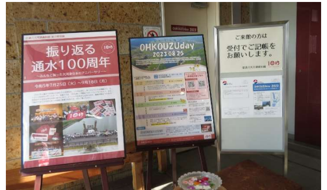
令和の大改修バーチャル見学会や大河津分水ナイトツアーなどを開催し、多くの方に来場いただきました。

期日：令和5年8月25日(金) 会場：信濃川河川事務所 大河津出張所他 参加：バーチャル見学会30名 大河津分水ナイトツアー15名 主催：信濃川河川事務所 協力：鹿島・五洋・福田特定建設工事共同企業体、加賀田組