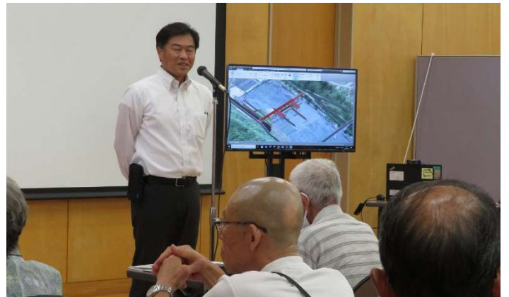
開会の挨拶として、信濃川河川事務所長より、大河津分水への想いをお話させていただきました。