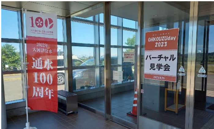
大河津出張所1階にて行ったバーチャル見学会は初めての試みでした。