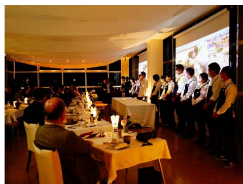
参加された皆さんからは「大河津分水の恵みでもある燕の食材を一流シェフの料理で本当に贅沢にいただきました！」との感想をお寄せいただきました。