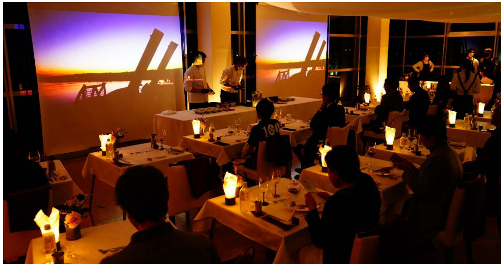
信濃川大河津資料館がフルコースレストランに大変身しました。