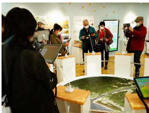
にとこみえ〜る館ではタブレットを使って令和の大改修の未来図を視聴いただきました。

大河津分水通水100周年を踏まえて、大河津分水の恵みである越後平野の食材を活かした料理が大河津分水を望む信濃川大河津資料館4Fにて振る舞われました。また、ディナーに先立ち令和の大改修現場見学ツアーも開催されました。