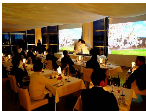
夕暮れとともに会場には大河津分水の季節の写真が投影され、幻想的な雰囲気となりました。