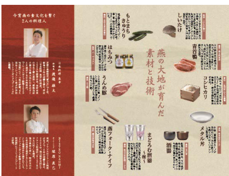
大河津分水を感じながら、越後平野の恵みを味わうプレミアムなダイニングには地元燕の食材や食器等が惜しげもなく登場しました。