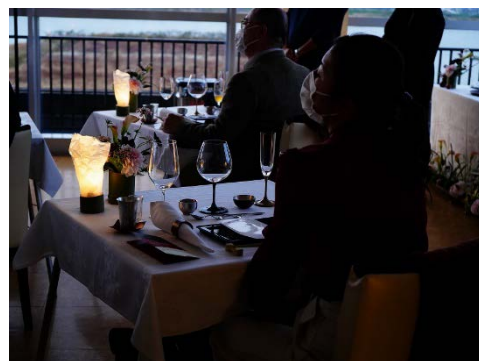
ディナー会場となった信濃川大河津資料館4F展望室。燕産のカトラリーがセッティングされ大河津分水を眺望できるレイアウトに。