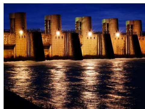
洗堰も一緒にライトアップ。豊かな信濃川の水を流す姿もまた美しいです。