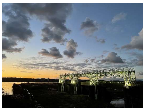
夕焼けに浮かぶ旧可動堰。これでも十分に見ごたえがある美しい景色です。

可動堰通水10周年、旧可動堰通水90周年を記念し堰のライトアップを実施。また期間中に2回、ナビゲーターの案内によるナイトツアーも開催しました。幻想的な可動堰の雰囲気を見に、多くの方が訪れました。