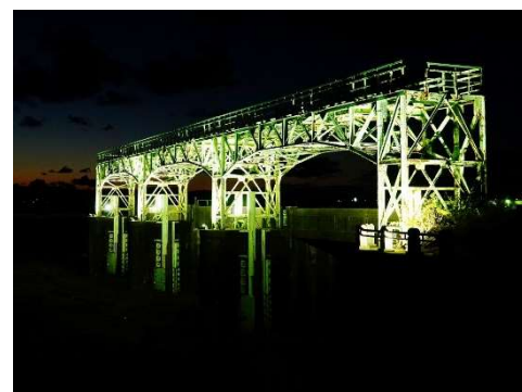
日が暮れるに連れてライトアップに照らし出された旧可動堰が鮮明になっていきました。