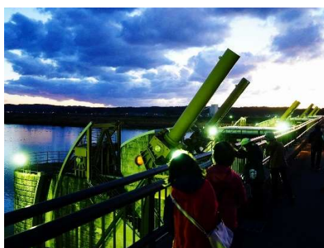
11月23日に通水10周年を迎えた現在の可動堰もライトアップ。「夜の可動堰はいつもより神々しく感じます」との声が聞かれました。