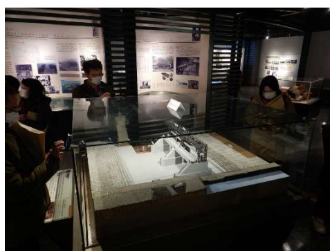
ツアーに先立って、信濃川大河津資料館内に展示している90年前につくられた可動堰の模型もご覧いただきました。