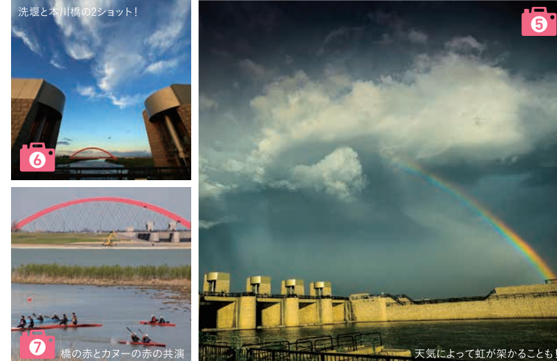
洗堰と本川橋の2ショット!

春夏秋冬、朝昼晩。季節や時間帯に合わせて、さまざまな表情をのぞかせる大河津分水。どの景色を切り取ってもスケールは壮大で、圧倒的な存在感をただよわす。四季の移り変わりが感じられる大河津分水… たまにはゆっくりと歩いてみませんか!