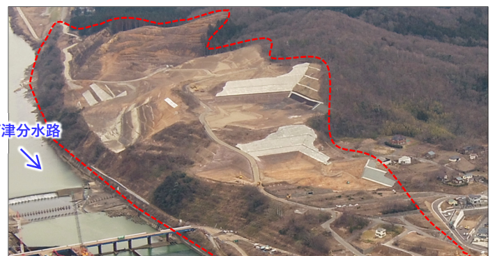
山地部掘削の工事状況 (撮影日：令和4年3月2日)