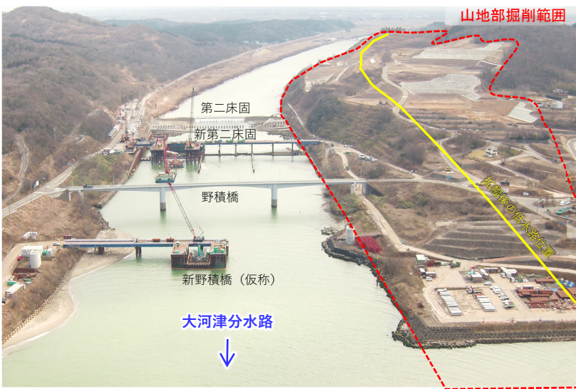
河口付近の工事状況 (撮影日：令和4年3月2日)

また、大河津分水路「令和の大改修」では、効率的・効果的な施工を進めるため、BIM/CIM (Building and Construction Information Modeling/Management) の導入を行っています。