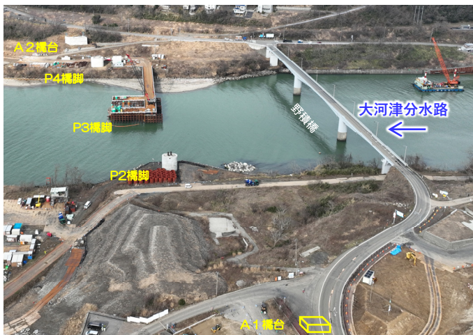
新野積橋 (仮称) P3橋脚本体、A1橋台施工の準備工事状況 (撮影日：令和4年3月2日)