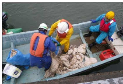
ふね 船による油の回収作業。