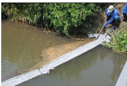
かわ 川などでの油の回収作業。

【油回収作業の状況】一流出した油の処理経費及び発生した損害は、原則原因者の負担になりますー