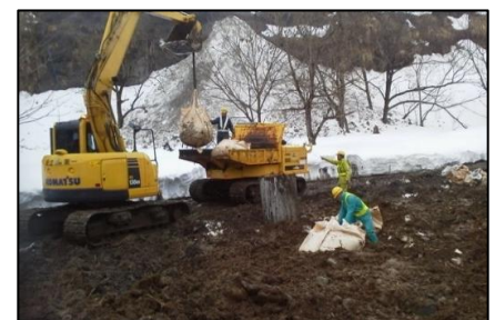
あぶら しんとう どしゃ てつきよさぎょう 油が浸透した土砂の撤去作業。