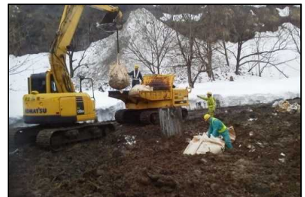
油が浸透した土砂の撤去作業。