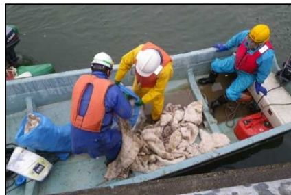
船による油の回収作業。