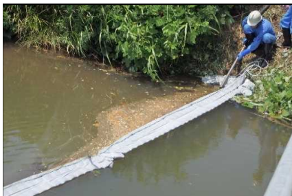
川などでの油の回収作業。

【油回収作業の状況】一流出した油の処理経費及び発生した損害は、原則原因者の負担になります-