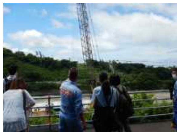
現場チャレンジコース