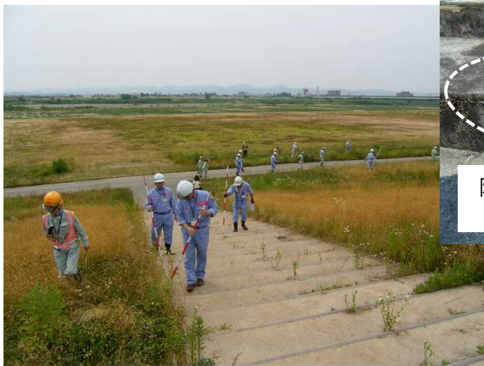
昨年度の点検状況 (長岡市信濃1丁目付近)