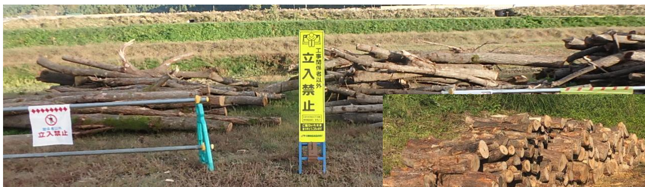
※写真は前年度の状況