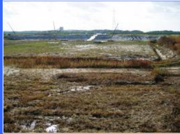
③ 右岸仮締切りより