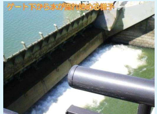
ゲート下から水が流れ始める様子