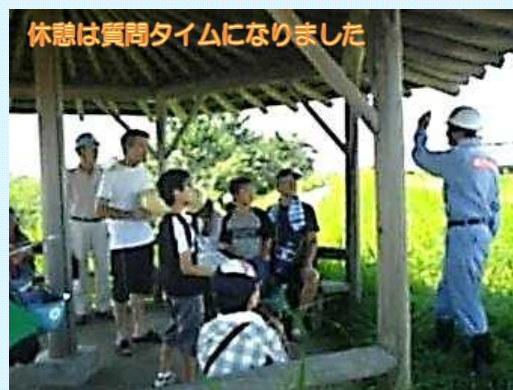
休憩は質問タイムになりました