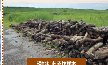
現地にある伐採木