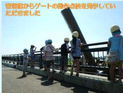
管理箱からゲートの動作点検を見学していただきました

参加者からは、「また参加したい」「良い見学会だった」などの好評をいただきました。