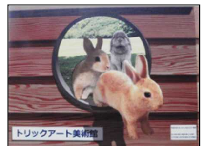
トリックアート美術館