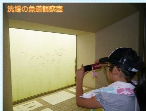
洗堰の魚道観察室