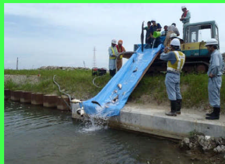
河川への放流状況