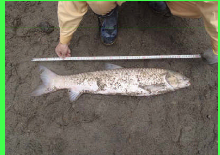
捕獲した魚（ソウギョ）