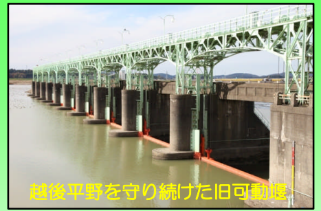
越後平野を守り続けた旧可動堰