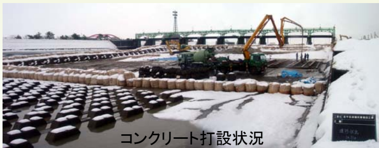
コンクリート打設状況

平成17年11月号(No. 4)にて紹介いたしました可動堰下流の第一床固災害復旧工事は、順調に進んでおり、1月末時点では工事全体の約8割が終了しています。