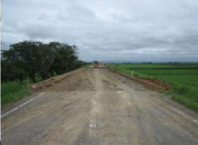
燕市野中才(下流)地先