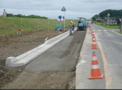
長岡市町軽井地先