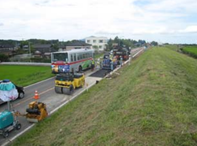
長岡市町軽井地先