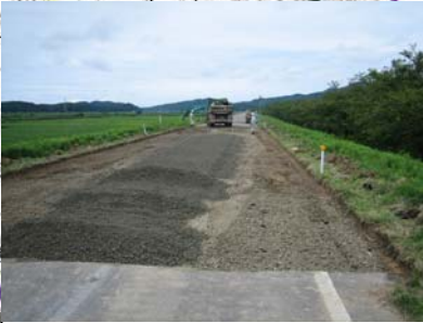
燕市野中才(上流)地先