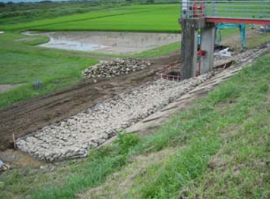
長岡市町軽井地先