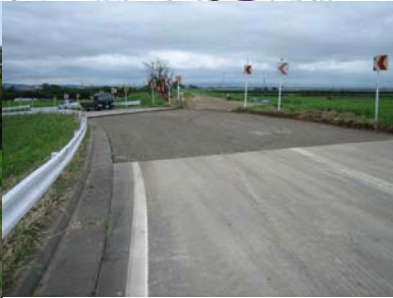
燕市野中才(上流)地先