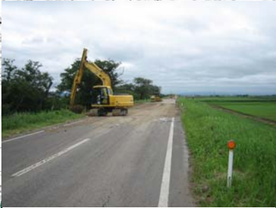
燕市野中才(下流)地先