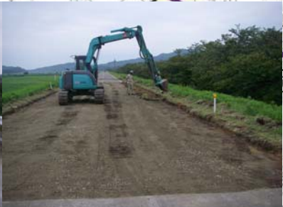
燕市野中才(上流)地先