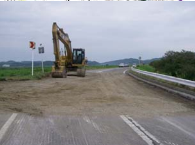
燕市野中才(上流)地先