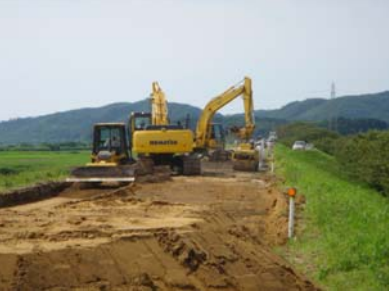
燕市野中才(下流)地先