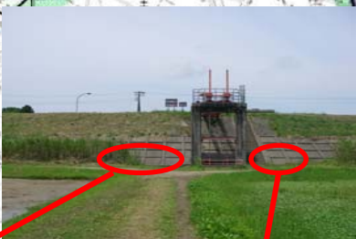
長岡市町軽井地先