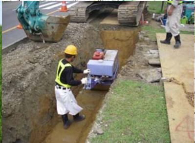
長岡市町軽井地先