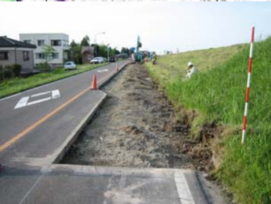
長岡市町軽井地先