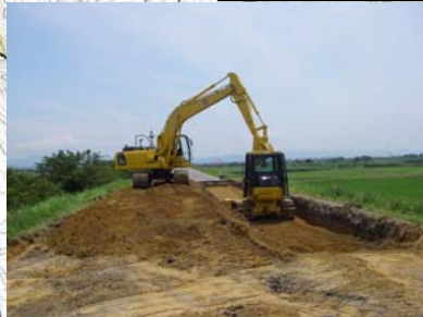
燕市野中才(下流)地先