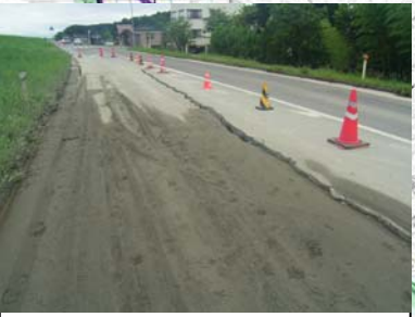
長岡市町軽井地先