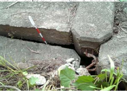
長岡市町軽井地先