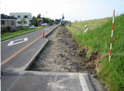
長岡市町軽井地先