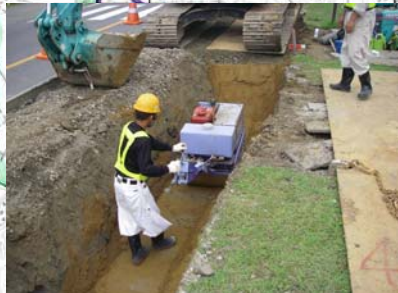
長岡市町軽井地先