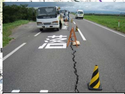
燕市野中才(上流)地先