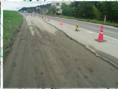
長岡市町軽井地先