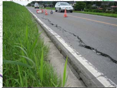
長岡市町軽井地先