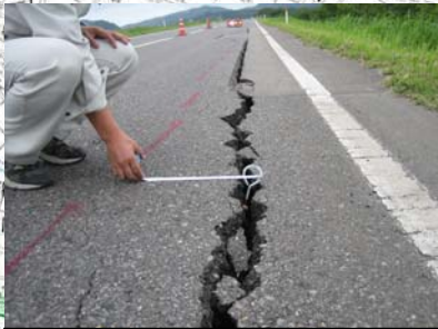
燕市野中才(下流)地先