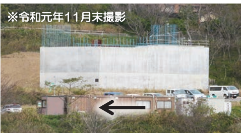
右岸側A2橋台の完成状況（写真1）