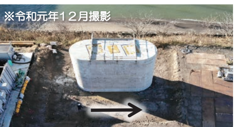
右岸側P4橋脚の施工完了状況（写真3）