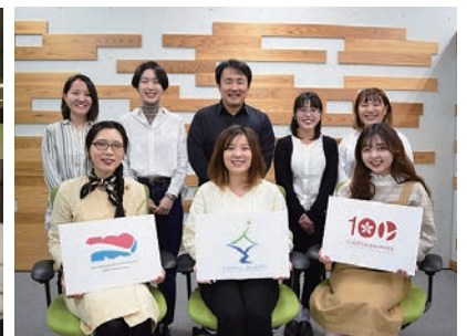
ロゴ制作に協力して下さった長岡造形大学のみなさん。