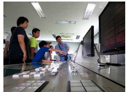
堰の操作室。スラリと並んだ可動堰の操作盤を前に、子ども達からは次々と質問が。