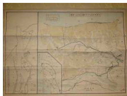
大河津分水の計画図面