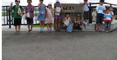
可動堰のプレートと記念撮影。この後「可動堰」を書いた人を探してもらいました。

可動堰や洗堰を特別にガイドするツアーを7月29日（土）に開催しました。「可動堰に使われているシリンダーはどこで作られたでしょう?!」などクイズに挑戦したり、普段は入れない堰の操作室を特別に見学したりと、親子で楽しく、大河津分水について理解を深めていただきました。