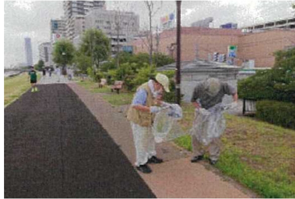
東新潟中央自治連合会