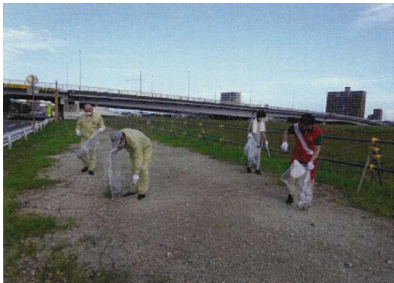
新潟県橋梁塗装技術協会