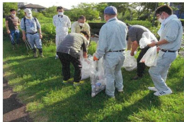
(一社)新潟市造園建設業協会