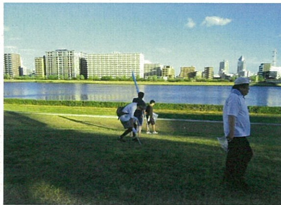
新潟信濃川ライオンズクラブ