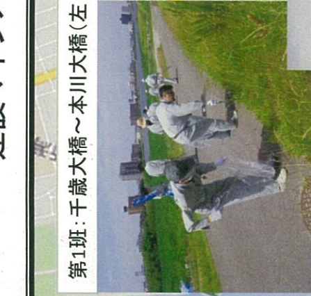
第1班:千歳大橋~本川大橋(左・右岸)8名