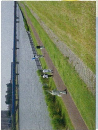
第3班:関屋分水路(左・右岸)7名

集合場所:新潟支店 用具配付 開会:美咲町堤防で挨拶 帰着:新潟支店 閉会:全員そろい次新新潟支店前