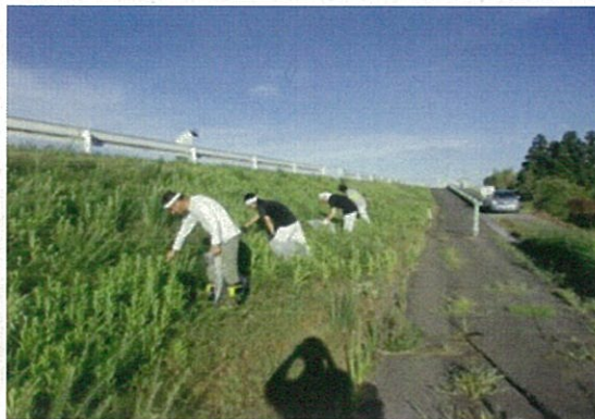
亀田郷土地改良区