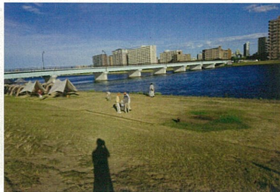
東新潟中央自治連合会