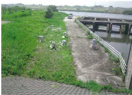
水田取水口上流側