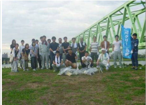
ダイダン (株) 新潟支店