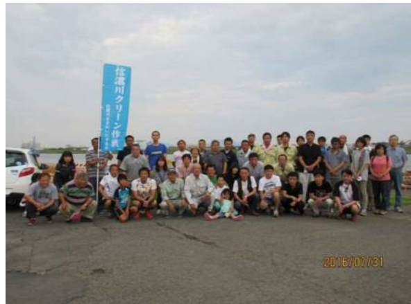
新潟県橋梁塗装技術協会