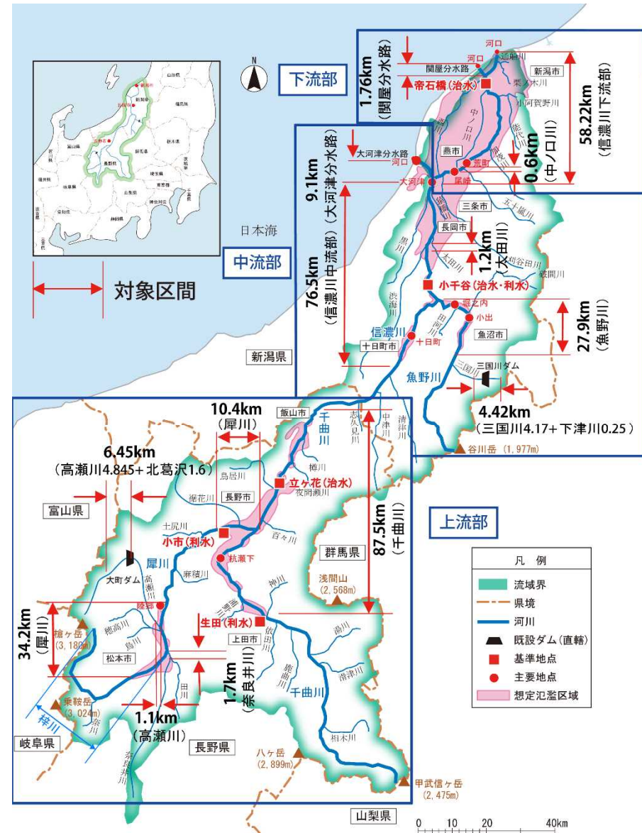
計画対象区間位置図(図1)

前回変更以降の事業調整及び協議進捗、近年の豪雨に対する取り組み、整備完了箇所等の時点修正を踏まえて変更。