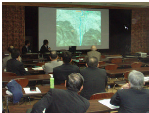
H20.10.26 住民懇談会（長野会場）

千曲川河川事務所では、 信濃川水系河川整備計画(大臣管理区間) の策定に向けて、学識者から千曲川・犀川の河川整備計画について意見を伺う「 信濃川水系学識者会議第3回上流部会 」を開催します。