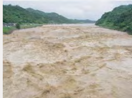
▲平成23年7月洪水の大河津分水路