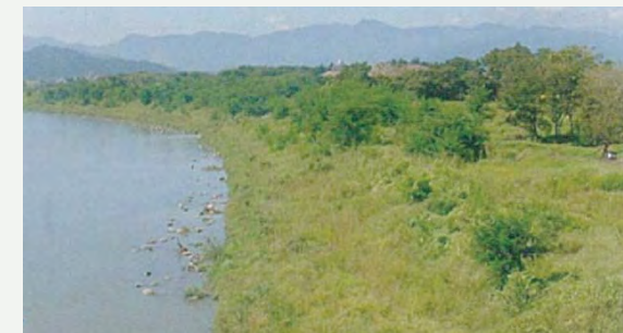
▲多自然川づくりの実施例（千曲川）

●河道掘削等の工事にあたっては、施工形状や方法を工夫することにより、湿地やワンド等の多様な生物が生息できるよう多自然川づくりを実施します。