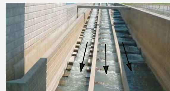
▲大河津新可動堰の魚道（平成23年11月通水）

●魚類が河川の上下流や本支川等を往来できるよう、水域連続性の確保など、魚がのぼりやすい川づくりを実施します。