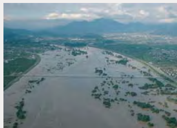
▲平成18年7月洪水 立ヶ花狭窄部（千曲川）

●河川整備にあたっては、平成16年、平成18年及び平成23年など、近年多発する洪水実績を踏まえ、戦後最大洪水と概ね同規模の流量を安全に流下させ、洪水被害が生じないように努めます。