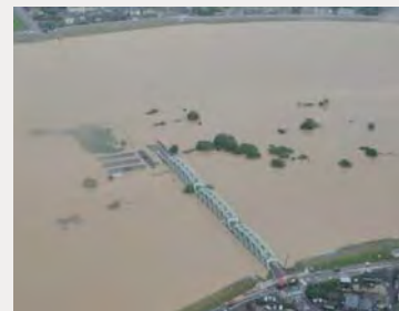
▲平成23年7月洪水 新潟市秋葉区小須戸橋（信濃川下流）