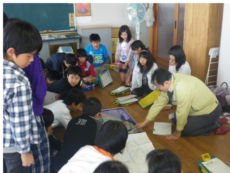
出前講座等による防災教育の推進

地域と一体となった防災拠点の整備や防災教育の拡充など地域防災力の向上にむけた取り組みを行い、流域全体の治水安全度の向上に努めます。