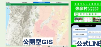
公開型GIS < 弥彦村 >