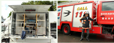
起震車など、様々な特殊車両が集結予定 < 弥彦村 >