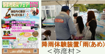
降雨体験装置「雨(あめ)ニティー号」 <弥彦村>

【弥彦村】 ○「弥彦村防災フェア2025」を関係団体等と連携して開催し、観光客、住民に対し流域治水について理解を深めるイベントを実施(10月、1回、来場者数 約600人)