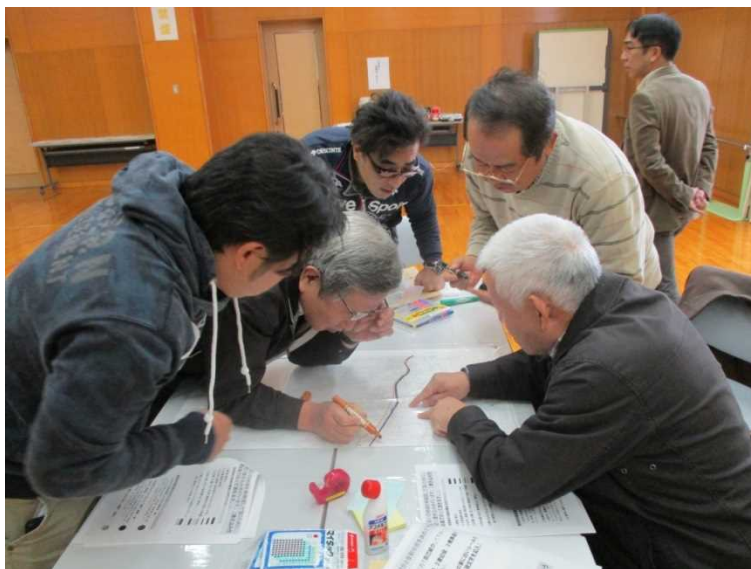
研修の状況(田上町総合保健福祉センター)

研修で学んだ議論の手法を各地域において実践していただくことで、地域の防災意識の向上が期待されます。