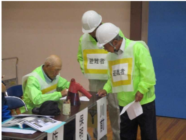
避難所運営訓練(田上町民体育館)