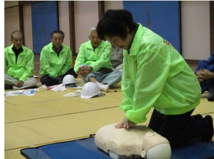
救命救急講習(田上町民体育館)